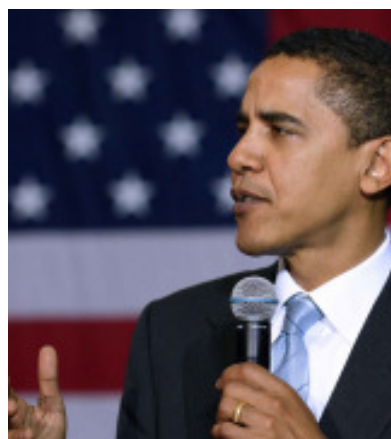
Obama: Medspiller for det etablerte Amerika.

Nå har han valgt sine medspillere, kolleger og regjeringsmedlemmer. De er alle framtrepende representanter for det veletablerte amerikanske systemet. Og for dem som