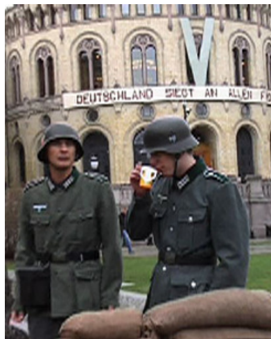
Tyske okkupasjonsoldater foran Stortinget i Norge.

- I mer enn femti år har norske journalister vært mikrofonstativer for israelernes utrolig vellykkede propagandaopplegg.