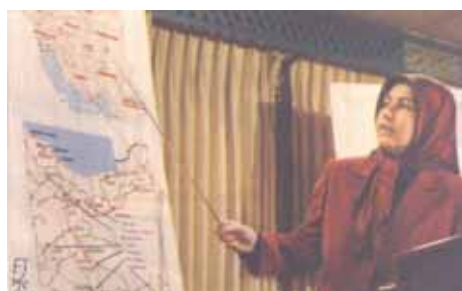
En representant for MKO peker ut bombemål for USA i Iran.